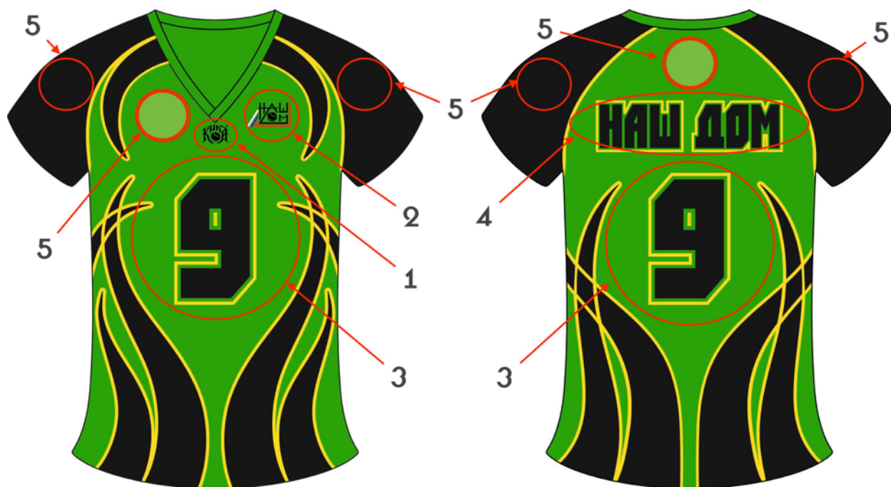
рис.1 – игровая майка

1 – Обязательно наличие на форме фирменного логотипа игры кила. Допускается расположение по центру, либо справа или слева на груди.