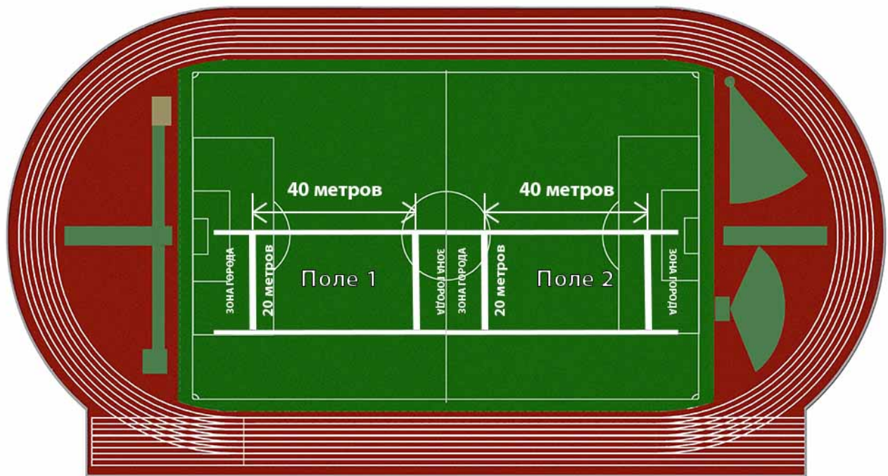
Рис. 3 – Вариант расположения 2-х полей для килы на стандартном футбольном поле